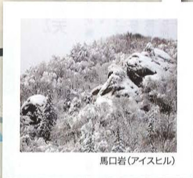
馬口岩(アイスヒル)